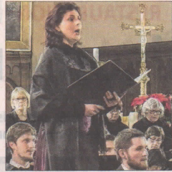
La soprano Catherine Bernardini a enchanté le public.